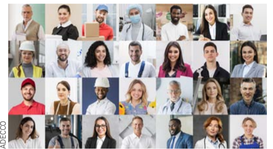
La diversidad y la innovación social son parte de Adecco.

Para Adecco, así como para muchas de las empresas que vienen de Suiza, la capacitación y el desarrollo profesional son elementos fundamentales del enfoque de un reclutamiento inclusivo e innovador. Al ser Suiza un pequeño país, sin recursos naturales, el camino que siguió para desarrollar una gran riqueza fue la educación y la capacitación de personas, entendiendo que esto otorga innovación y plusvalía. Por lo mismo, Adecco cuenta con su