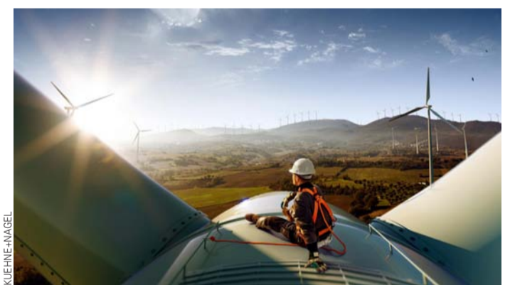
Ofrecer soluciones logísticas para descarbonizar es parte de la oferta.

Respecto a sus prioridades en materia de sostenibilidad, incluidas en el pilar "Living ESG": "Queremos ser un referente en la industria a través de las soluciones que ofrecemos para descarbonizar, además de brindar consultoría logística especializada. Nosotros analizamos la huella de carbono actual de nuestros clientes y sus metas de reducción para que, a partir de eso, podamos