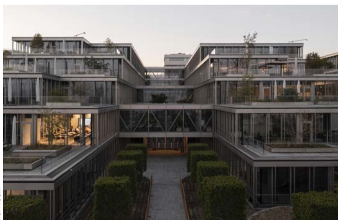
El Campus Unlimitrust ubicado en Suiza busca promover la confianza a nivel global a través de la sinergia de nuevas ideas, colaboraciones y el desarrollo de nuevas tecnologías para la confianza.

El campus materializa esta misión reuniendo en un mismo espacio a una comunidad que tiene como objetivo aprovechar