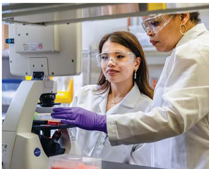
En 2022, 766 millones de personas se beneficiaron de la innovación de Novartis en el mundo.

La empresa utiliza la innovación basada en la ciencia para abordar algunos de los problemas de salud más desafiantes de la sociedad.