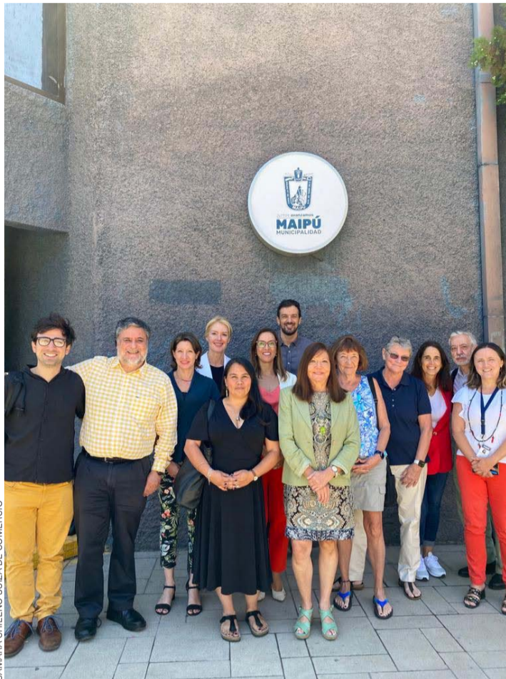
Coalición de Alto Impacto Social en la Comuna de Maipú.

¿Y por qué las empresas suizas? Uno de los objetivos de la