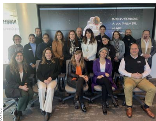
Comité de Educación y Empleo CCHSC.

Las compañías en Suiza conocen claramente los beneficios de contar con aprendices en sus diferentes áreas de producción y corporativas, una vez que son incorporados formalmente a la plantilla laboral, donde, a pesar de los riesgos de baja, el resultado final resulta ser una inversión inteligente, no solo desde el punto de vista rentable, sino también social y emocional,