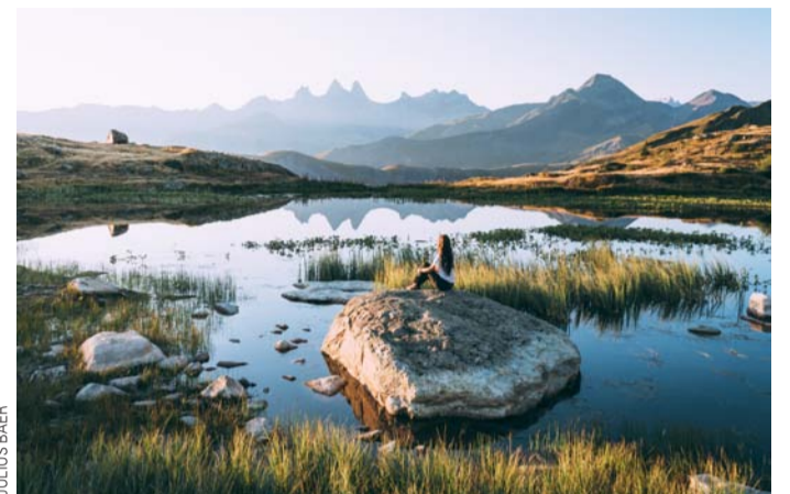
La sostenibilidad y estrategia climática son prioritarias para la empresa.

Julius Baer se compromete a abordar estos desafíos centrándose en ser un gestor de patrimonio responsable y abordando los desafíos que enfrenta la industria. Para ello, la compañía llevó a cabo una nueva evaluación de materialidad en 2022, identificando los 16 temas más importantes, con el cambio climático y las bajas emisiones de carbono a la cabeza. La estrategia global de sostenibilidad es un elemento clave para el nuevo ciclo 2023-2025, con el objetivo de crear valor más allá de la riqueza para los clientes y cumplir con nuestras obligaciones como