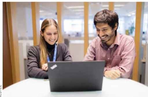
Con el programa, 86 mil jóvenes han conseguido empleo.

Este 2023, 140 estudiantes ingresaron a la