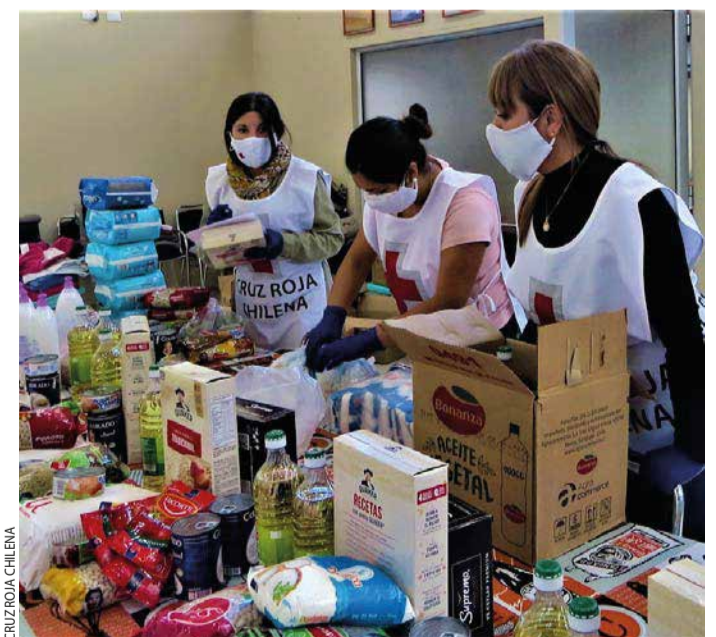
Entrega de ayuda por la Cruz Roja en La Araucanía.

La Cruz Roja tiene sus orígenes en la ciudad de Ginebra. Por ende, la Embajada de Suiza