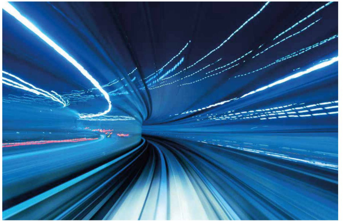
Suiza destaca por ser un país líder en innovación tecnológica, respaldada por un trabajo permanente en investigación y desarrollo de nuevos productos y servicios.

know how, tecnologías, nuevas prácticas, formación y empleos de calidad. Todo esto, respondiendo a las crecientes y cada vez más complejas necesidades del mercado, y colaborando de esa manera con la eficiencia y la productividad del mismo.