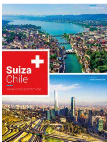
Publicación disponible en embajadasuiza.cl .

El estudio realizado por la Embajada de Suiza y la Cámara Chileno-Suiza de Comercio entrega una visión estratégica sobre las relaciones comerciales bilaterales, revelando el impacto real de las cerca de 200 empresas suizas instaladas en Chile.