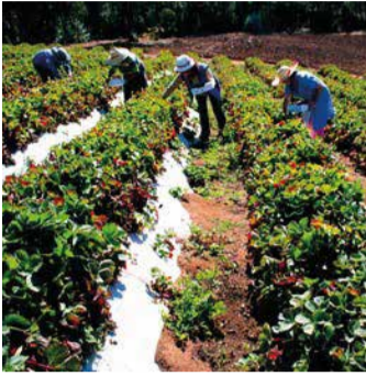
SuizAgua ha ejecutado 41 proyectos, alcanzando un ahorro de más de 513 mil m 3 de agua al año.

En el país, Fundación Chile ejecuta el programa desde