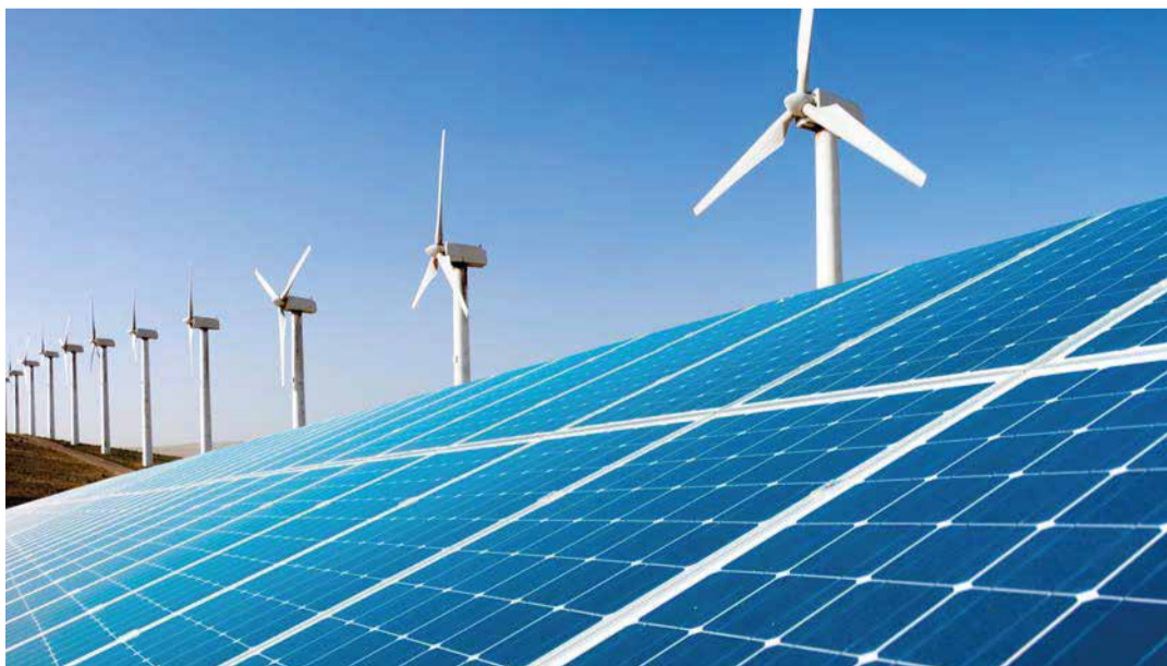
La sustentabilidad y la eficiencia energética son hoy temas clave en la presencia empresarial suiza en Chile.

Generar valor a sus socios ha sido siempre el propósito fundamental de esta asociación gremial, que hoy celebra su aniversario y que reúne a más de cien participantes activos.