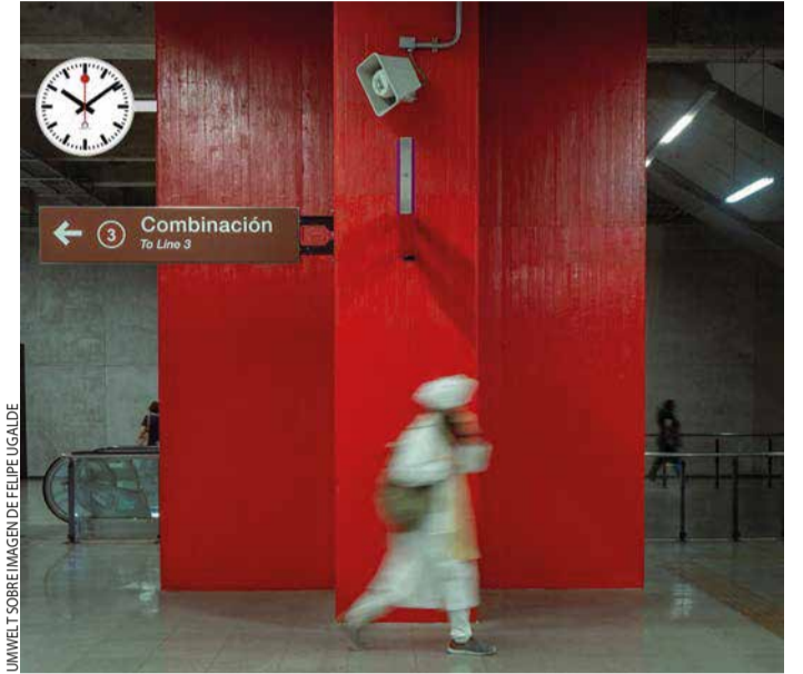
Primer reloj suizo analógico de la red.